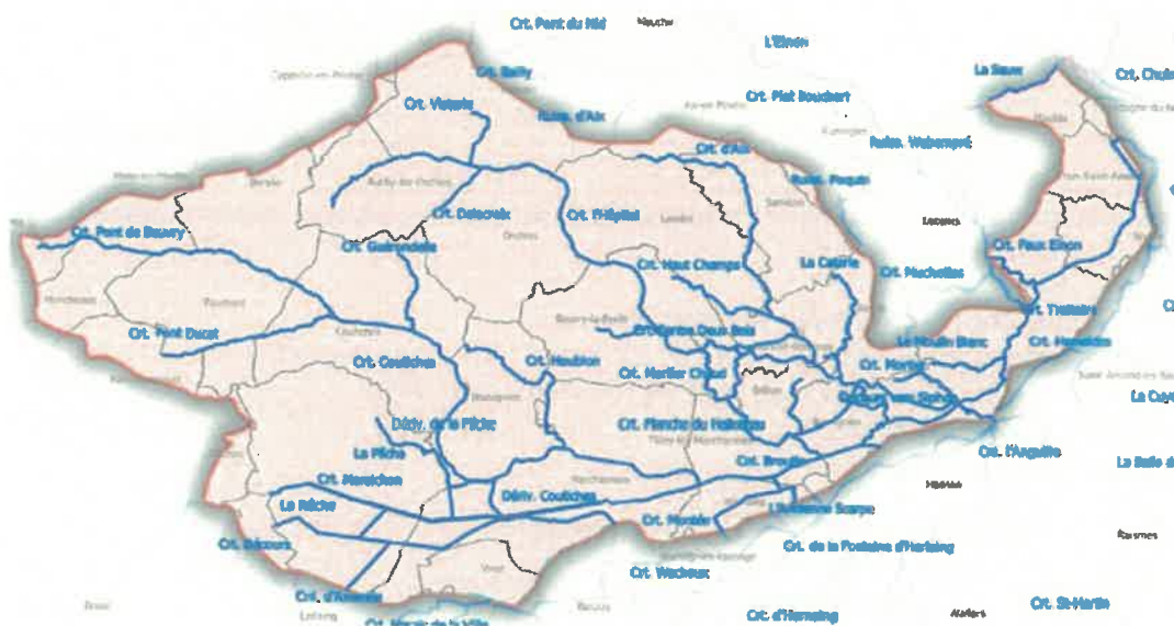
Carte 1 : localisation des cours d'eau et communes concernées

VU POUR ETRE ANNEXE à mon acte en date du 27 DEC. 2023